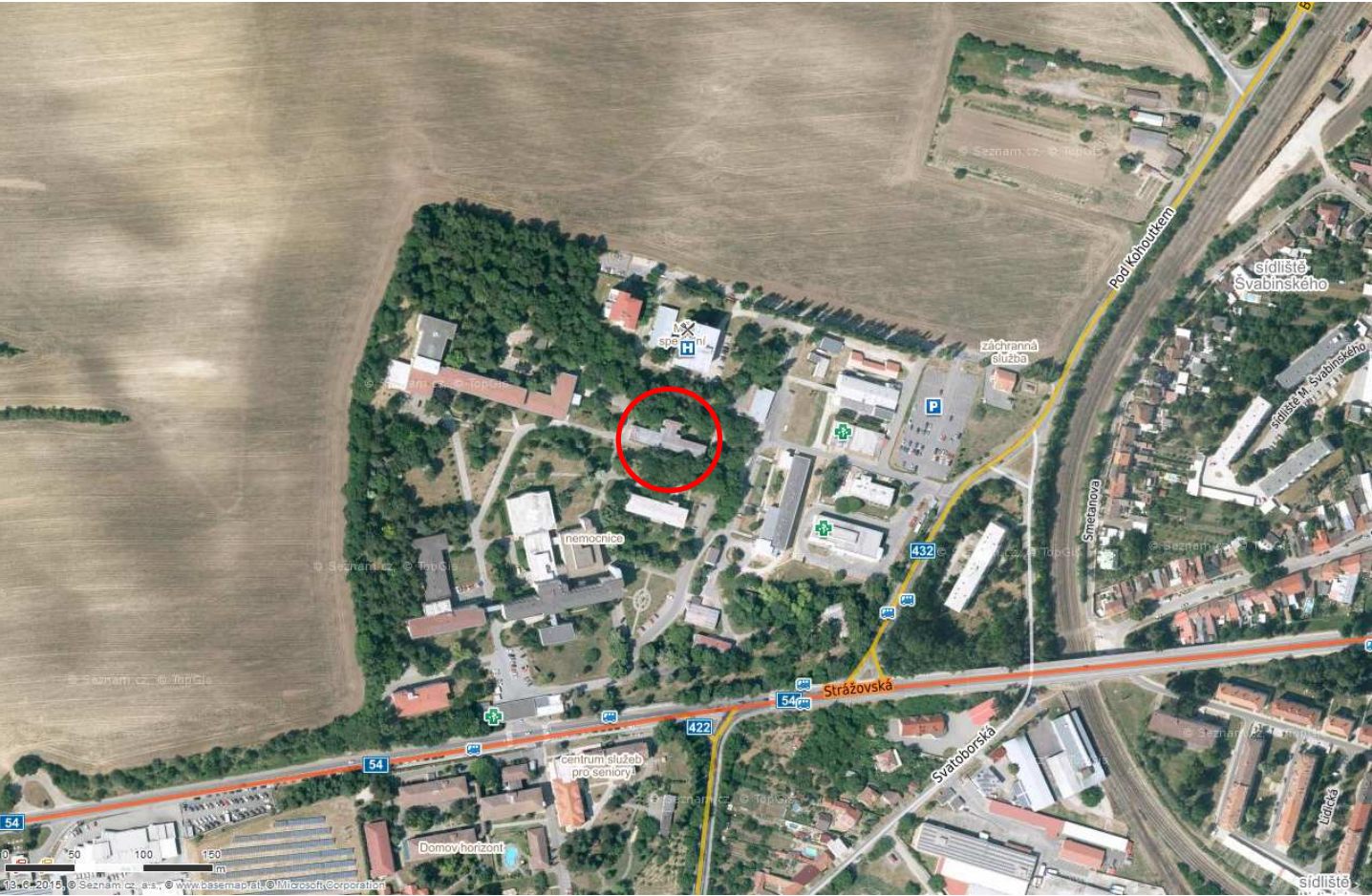
Umístění v rámci nemocnice